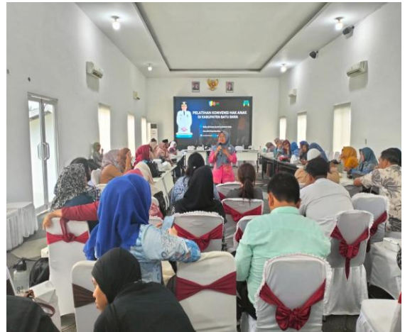
Kegiatan Pelatihan Forum Anak Kabupaten Batu Bara