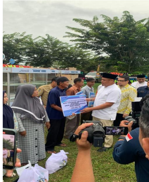
Bupati dan Wakil Bupati Kabupaten Batu Bara Menyerahkan Bantuan “PKH Bahagia” secara simbolis kepada Masyarakat Batu Bara