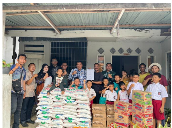
Penyerahan Bantuan Logistik Kepada LKS