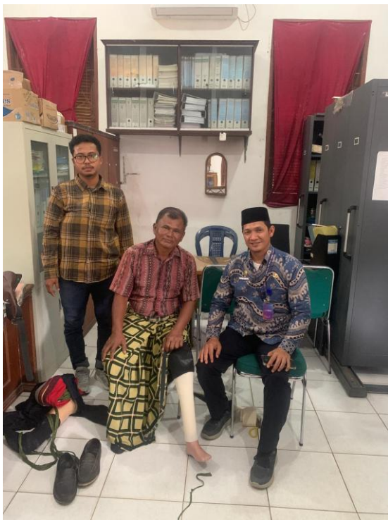
Penyerahan Kaki Palsu