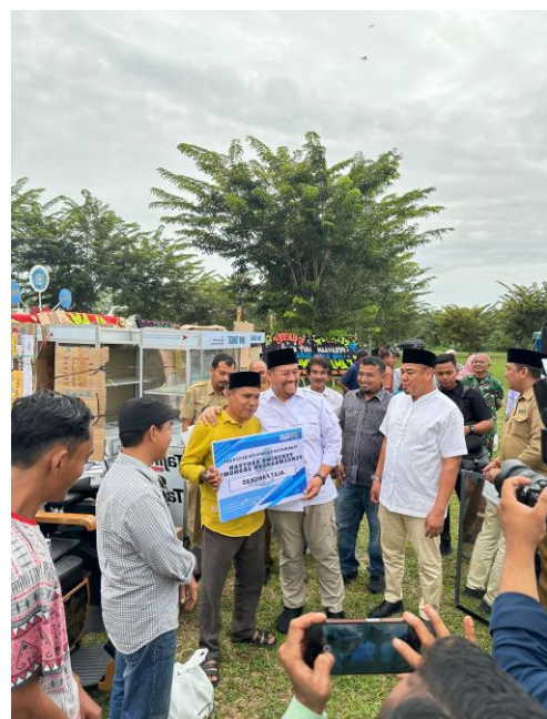
Pemberian Bantuan Usaha Ekonomi Produktif Kepada 84 KPM Masyarakat Kabupaten Batu Bara